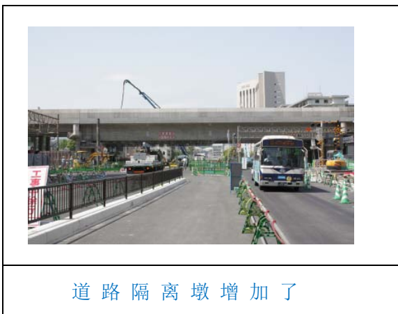
道路隔离墩增加了

对上述种种社会“新现象”，日本人为之扼腕叹息，细想起来，其中很多都是任何国家经济萧条后的规律。日本在这方面也与国际接轨。