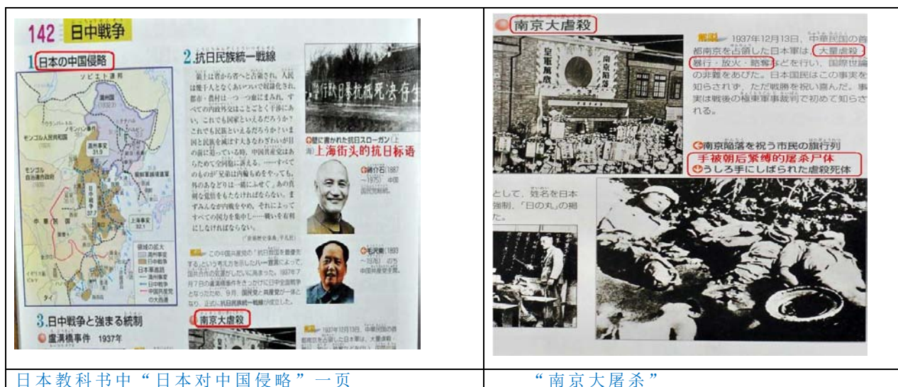
日本教科书中“日本对中国侵略”一页

半个世纪以来，日本国内舆论主体，特别是教育界对“二战”期间日本对外扩张并加害亚洲各国的历史一直持批判反省态度，绝大多数教育工作者可谓旗帜鲜明。因此，各出版社编写出的有关历史事件的立场只能顺应社会潮流。直至今日，使用“承认侵略加害他国”历史教科书的初高中仍占 95% 以上。