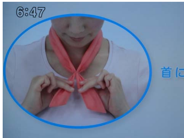
降温效果立竿见影的红领巾

得到了空前的调动，很多土法上马的应急措施也不断问世。其中利用“红领巾”来降温的方式在电视广告中令人耳目一新。