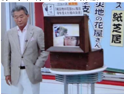
主持人米野和老古董“洋画箱”

说唱“纸板画剧”时经常使用一种被称为“洋画箱”的道具，简单轻便，街头路边支起后，周围立刻被孩子们里三层外三层包围。当然，除了“洋画”内容是否新颖以外，“洋画”大师的口才是关键。没想到，在已进入数字电视时代的当今，日本 TBS 电视台居然把 80 年前的老古董“洋画箱”对准电视机前的观众，用作上午黄金时间的专题报道。尽管现在使用照片替换了过去的手工绘画，其使用“洋画箱”的“老把戏”勇气不得不让人佩服。