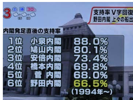
各 届 内 阁 上 台 后 支 持 率 调 查

老百姓也可以通过这种调查来进一步验证判断自己今后跟着哪个党走，将票投给谁。尽管越来越多的人开始认为哪个党都半斤八两差不多。