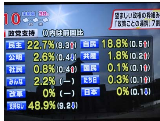
两任日本内阁支持率对比

在日本，选举前各党派当选票数的调查，当选前后支持率的调查，政党党魁和地方行政长官竞选前后，重大政策调整时的民意调查，等等，各种舆论调查每个月都不止一次。调查时有街头采访，打电话询问等方式。调查对象一般在 1000 人至 3000 人之间，由于抽样调查的对象不同，各报社的调查结果会出现不同，但是人们发现，绝大多数情况下，各报社的调查结果很少出现大的差距。因为几家报社结果同时公布，如果哪家报社的调查结果与其他报社的结果差距过大，人们对该报社的信誉必然产生怀疑。因此，这种调查也是对实行调查单位本身的测试，你的调查结果如与众大不相同即意味着你的调查活动不