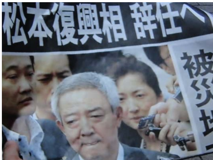
国家复兴部部长松本龙辞职

7 月 3 日，当这位中央部长松本龙先生到宫城县会见该县县知事村井时，只因自己先进入会客室后等待村井知事等了 1 分 47 秒，顿时“龙颜”变色。