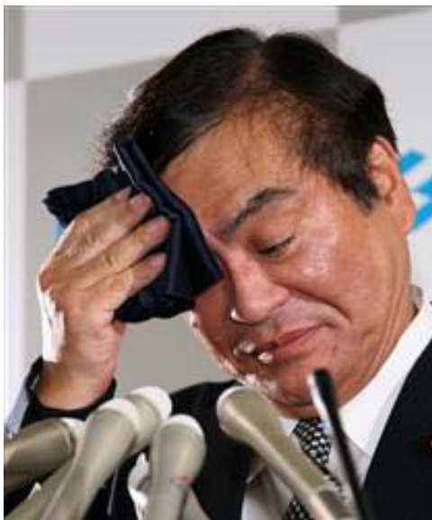
钵吕吉雄大臣宣布辞职

无独有偶，在野田佳彦8月底就任首相后新内阁成员中担任经济产业省大臣的钵吕吉雄在视察福岛灾区时，讲了句受灾城市“如同死城”，并对记者指着袖子开玩笑说：“看，放射线”。结果，这两句话被媒体的曝光后，引起社会极大公愤，人们说堂堂的国家大臣讲话伤了受灾群众的感情，尽管钵吕大臣马上道歉希望党（执政民主党）在给他立功赎罪的机会，但是已经晚了。鉴于自民党等反对党要在即将召开的国会上将此事作为“大批判大革命”的靶子对新成立的野田内阁进行狂轰滥炸，并追究野田佳彦首相在任命使用方面的责任，为了削弱在野党攻击的炮火，野田佳彦只能请钵吕提出辞呈离开大臣岗位。