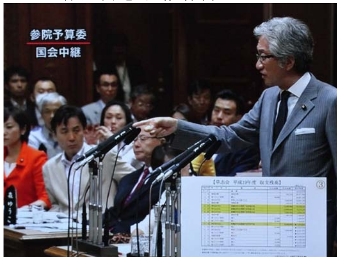
拿出政治献金的帐本追究菅直人的经济问题