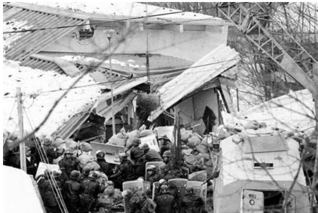
浅间山庄“革命根据地”终被攻克

反映劳资矛盾的工人罢工（半天以上），从1974年的5197次减少到2007年的54次，相当于高潮时期的1%。按传统观念，日本工运陷入最低潮，再怎么煽风点火也很难崛起。随着丰田本田日立产品的大量输出，日本成功地把罢工暴乱污染和贫富差距转移出口到了海外，并盛气凌人地说他们更社会主义。