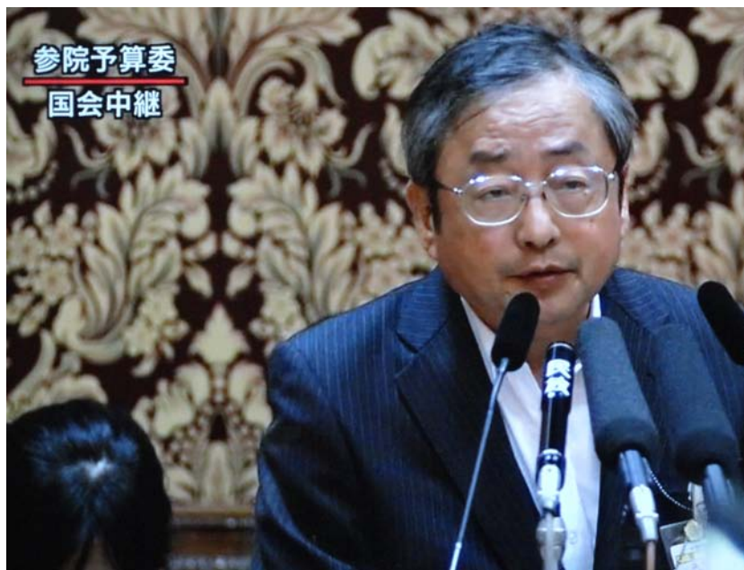
检察院代表出面作证