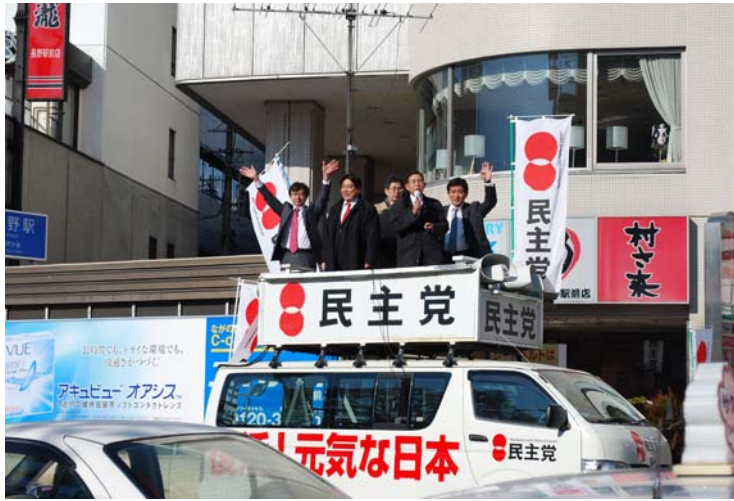
民主党的竞选宣传车