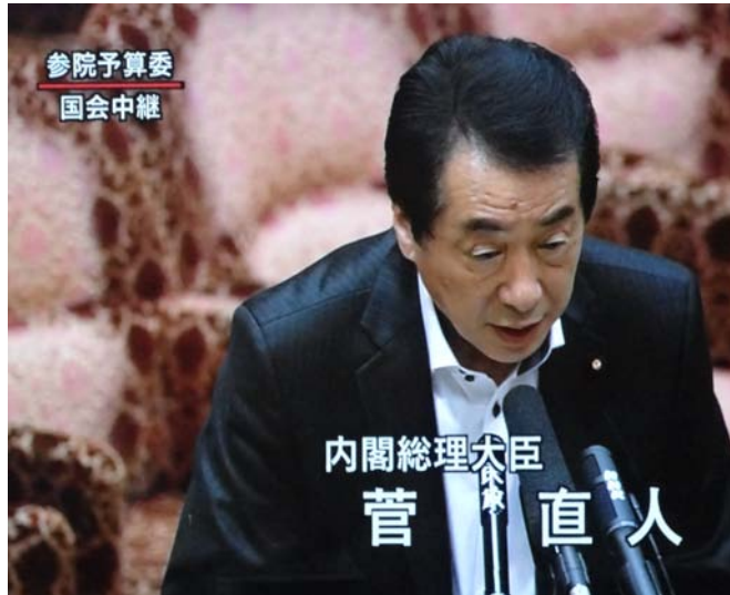
菅直人总理作答辯