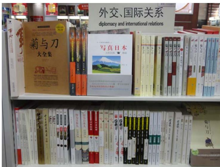
北京王府井新华书店书架上的『写真日本』

写真日本大和民族“和”之奥秘，以馈祖国“和谐”号时代列车建设者。——作者 李聚会